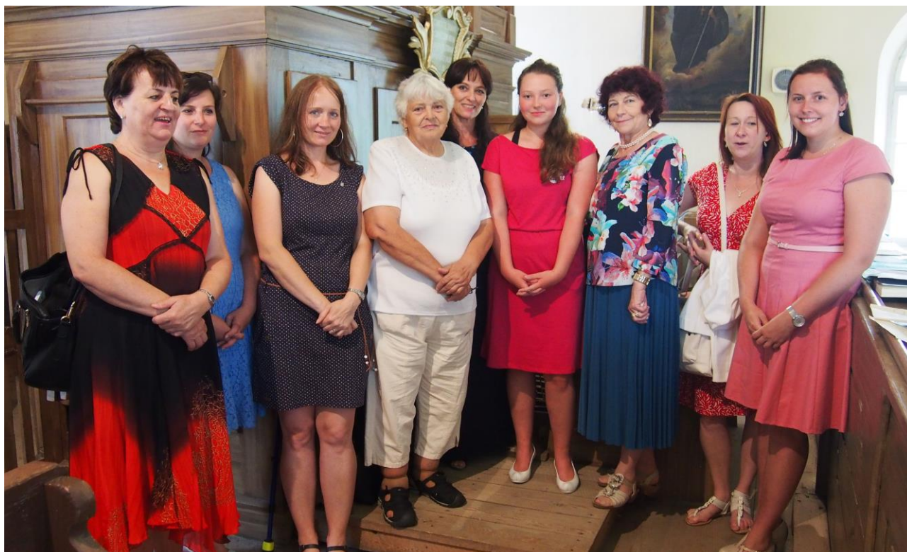
Fotografie z letošní pouti, kdy se bohužel nemohly zúčastnit všechny členky chrámového sboru.

Chtěla bych poděkovat všem, kteří v tomto sboru působí nebo působili dříve. Jsou to především stálí zpěváci nebo spíše zpěvačky na kůru při nedělních mších, mé bývalé žákyně i žáci, mí věrní rodinní příslušníci a ochotní přátelé, kteří pomáhají se zpěvem a někdy i s doprovodem či zástupem při mé nepřítomnosti, dále těm, kteří se přidávají i jiným nástrojovým doprovodem.